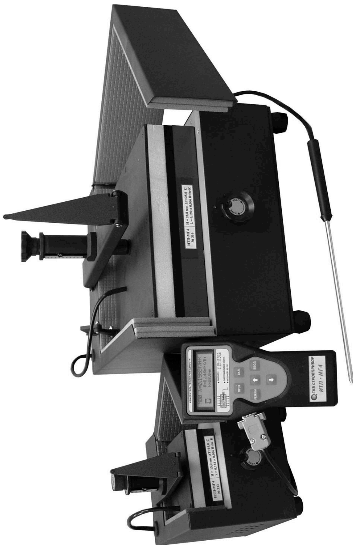
Рисунок 1.1 - Общий вид прибора ИТП-МГ4