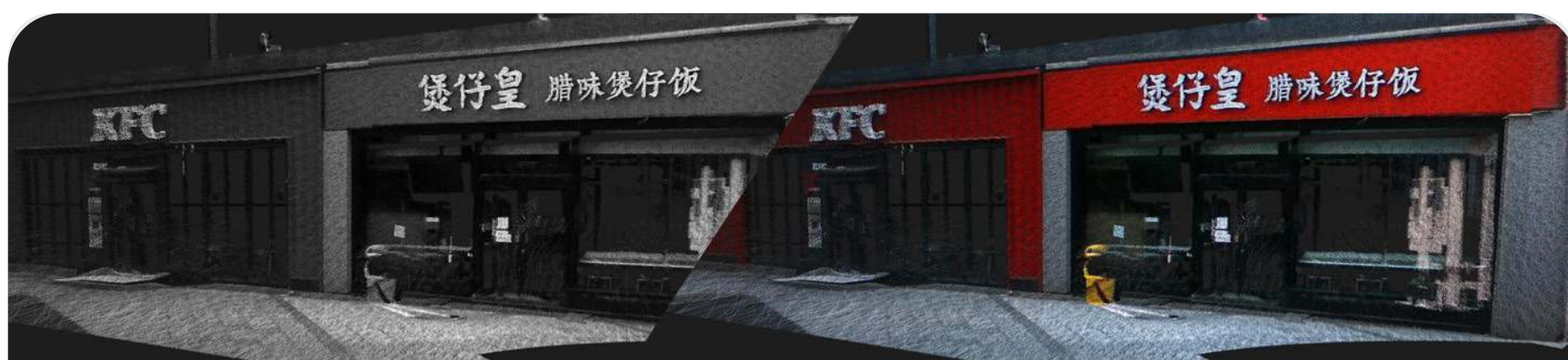
Обычное облако точек