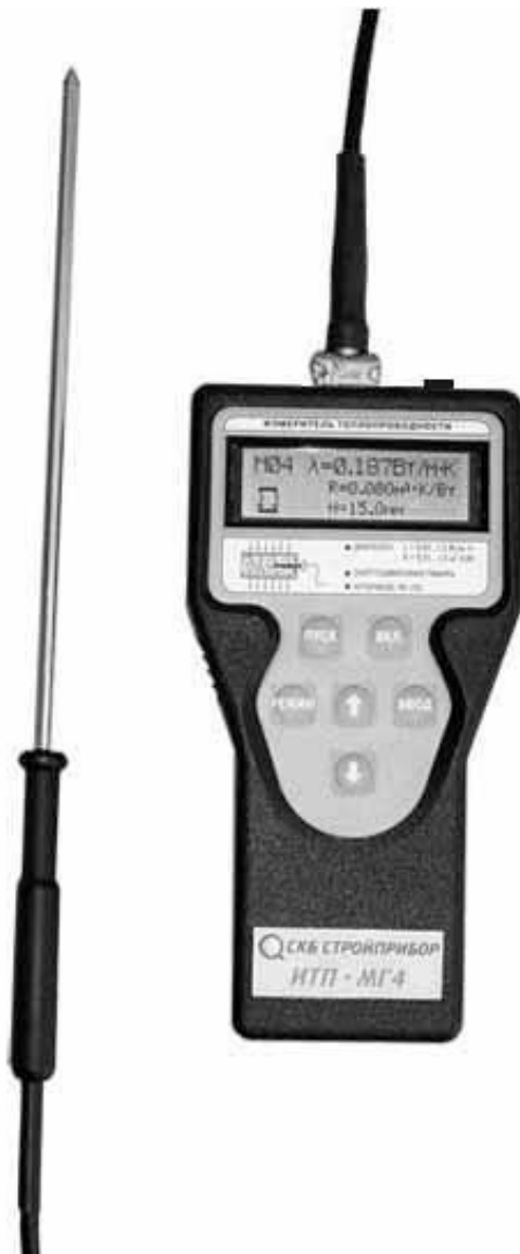
Рисунок 1.1 - Общий вид прибора ИТП-МГ4 «Зонд»

1.3.2 Прибор поставляется заказчику в потребительской таре.