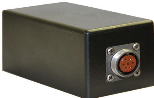
Рис.3 Блок PS-2

Для работы от сети необходимо использовать входящий в комплект блок PS-2/АС . Блок управляет подачей напряжения на обмотку электромагнита посредством управляемого реле, соединенного с кнопкой «Пуск» на корпусе электромагнита.