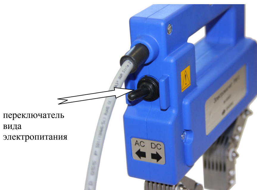
Рис.2 Переключение питания от переменного или постоянного тока

В электромагните предусмотрено две обмотки для различного типа электропитания: обмотка для переменного тока и обмотка для постоянного тока. Переключатель типа электропитания расположен на корпусе рядом с выводом кабеля.