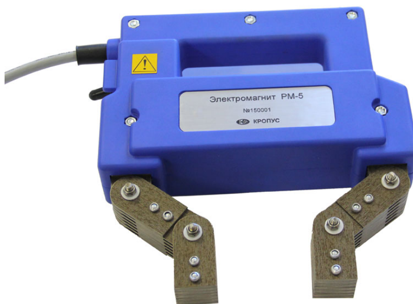
Рис.1 Намагничивающее устройство шарнирного типа

Шарнирное соединение магнитопровода обеспечивает свободу установки полюсов электромагнита на контролируемую деталь.